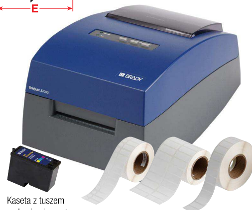
Kaseta z tuszem na bazie pigmentu CMY do drukarki J2000