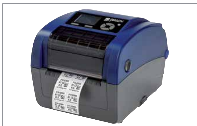
Krok 3: Drukowanie